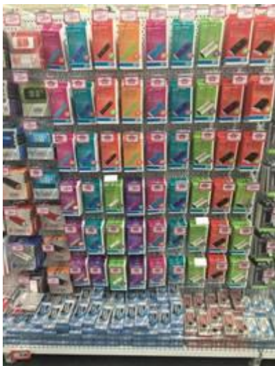
Powerbanks bij Media Markt