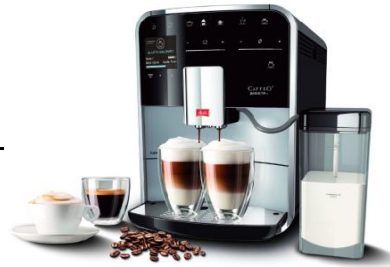
Barista Smart T - Zilver F830-101