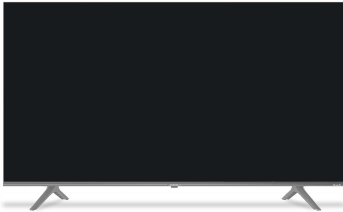
Roku TV 4k/UHD Smart TV