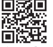
A használati utasítás aktuális változata a www.medisana.com internetoldalon található.

A folyamatos termékfejlesztések során fenntartjuk a jogot a műszaki és formai változtatásokra.