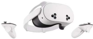
Meta Quest 3S