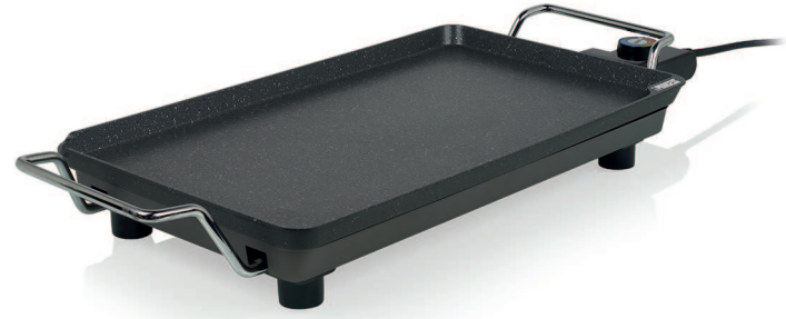
TABLE CHEF Pro Classic 01.102233.01.750

PARTS DESCRIPTION / ONDERDELENBESCHRIJVING / DESCRIPTION DES PIÈCES / TEILEBESCHREIBUNG / DESCRIPCIÓN DE LAS PIEZAS / DESCRIÇÃO DOS COMPONENTES / DESCRIZIONE DELLE PARTI / BESKRIVNING AV DELAR / OPIS CZĘŚCI / POPIS SOUČÁSTÍ / POPIS SÚČASTÍ / ОПИСАНИЕ ЗАПЧАСТІ