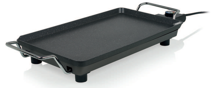
TABLE CHEF Pro Classic