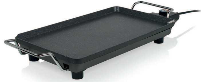
TABLE CHEF XXL Classic 01.102234.01.750

PARTS DESCRIPTION / ONDERDELENBESCHRIJVING / DESCRIPTION DES PIÈCES / TEILEBESCHREIBUNG / DESCRIPCIÓN DE LAS PIEZAS / DESCRIÇÃO DOS COMPONENTES / DESCRIZIONE DELLE PARTI / BESKRIVNING AV DELAR / OPIS CZĘŚCI / POPIS SOUČÁSTI / POPIS SÚČASTI / ОПИСАНИЕ ЗАПЧАСТИ